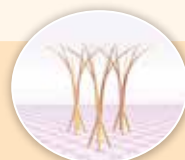
毛が根元から立ち上がる ピュースプリング®構造