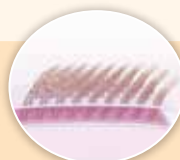
自然な分け目 ダブルアップ®機能