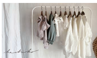
いよてつ 高島屋 初出店