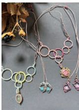
レインボーエレファント 〈Rainbow Elephant〉 アクセサリー・雑貨

愛媛県在住のクリエイターが手掛ける“ワクワク”するようなバッグ・服・アクセサリー・雑貨などをご紹介します。