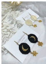
ソブレビビル 〈sobreviviru〉 アクセサリー