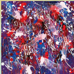
ジョンワン 「No mans Land」(80×80cm)