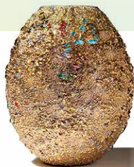
「Aurora 包輝 (August 10th, 2025)」 (17.5×17.5×20.8cm)

1955年石川県生まれ。生物学の研究者から陶芸の道を志し、現代美術家として活動するという異色の経歴の持ち主です。世界初となるガラス質の深紅釉(希赤[きせき])・水滴の輝きを永遠化する釉(グレイズ)が代名詞。自身が当主を務める今九谷窯は創業150年、九谷焼開祖大聖寺藩主前田家の唯一の御用窯です。