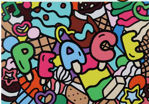
「LOVE ICE CREAM」(65×45.5cm)

湘南出身。“LOVE&PEACE”をテーマに、親しみとユーモア溢れる作品を色鮮やかさと大胆かつ力強い線で表現します。