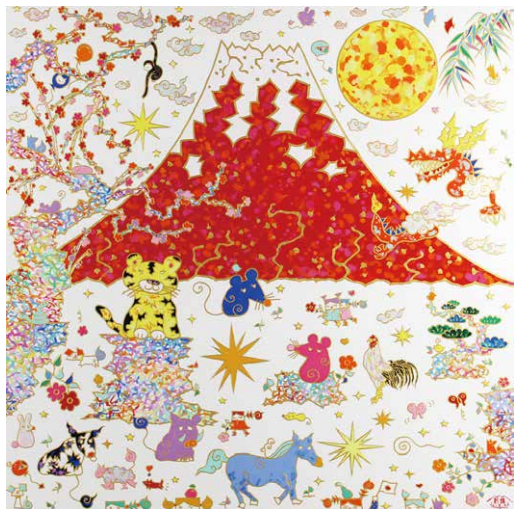
「十二支赤富士図」(S20号)

2019年 東京藝術大学大学院修士課程デザイン科描画・装飾研究室(押元一敏研究室)修了