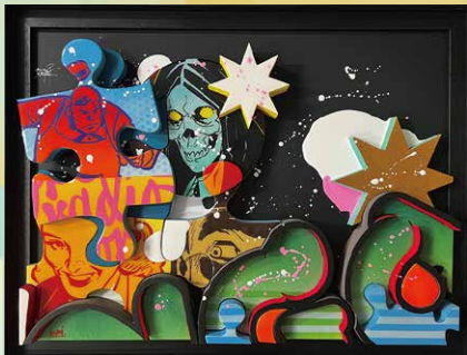
ケイミ「運命的な愛」(64×84cm)