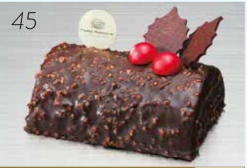
45 お届け日:12月22日(土)→24日(月・祝) 25542 いよてつ 高島屋 限定 ヘーゼルナッツプラリネとチョコクリーム を贅沢なナッツとチョコでコーティング。 〈クワッシュアーモンド〉 〈ビエール マルコリーニ〉 プッシュドゥ ビエール 2018 (約11×8.5×高さ5.5cm) 7,597円 [5個限り]