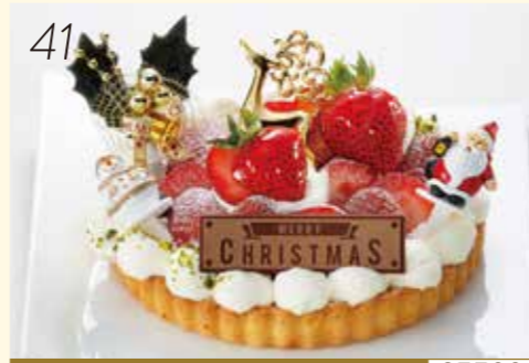
41 お渡し日:12月24日(月・休) 25500 サクサクのタルト生地にアーモンドとカスタード チョコレート クリーム。上にはたっぷり国産苺をのせて。オーナメント 〈パティスリーカフェ アイナ〉 サンタさんの苺畑 (直径約15cm) 3,888円 [30個限り]