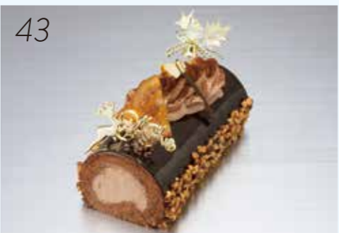
43 お届け日:12月22日(土)→24日(月・祝) 25526 優しい甘さの堂島ロールのクリーム にチョコレートのコクがマッチ。 〈パティスリー モンシェール〉 ノエル・ショコラ (約17×10×高さ7cm) 4,320円 [5個限り]