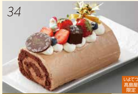
34 お渡し日:12月24日(月・休) 25437 いよてつ 高島屋 限定 ふわふわのココアのシートに、生チョコ クリームを巻き、あまおとめを飾りました。 〈パティスリー ラフ&ラフ〉 雪降るノエル (7.5×15×高さ7cm) 3,780円 [30個限り]