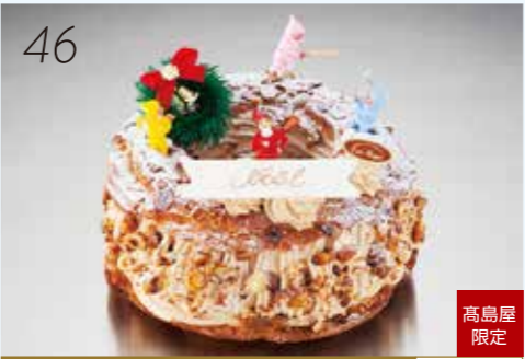
46 お届け日:12月22日(土)→24日(月・祝) 25550 いよてつ 高島屋 限定 ヘーゼルナッツバタークリームを シュー生地との食感でお楽しみください。 〈神戸・南京町 エストロイヤル〉 パリ・プレスト (直径約18cm) 4,968円 [5個限り]