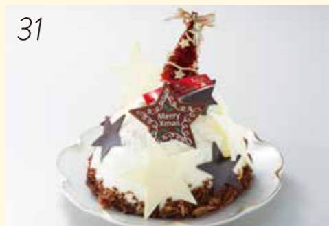
31 お渡し日:12月24日(月・休) 25402 ドーム型のケーキの中にはキャラメルクリームと フランボワーズのコンフィチュール。 〈ルフラン ルフラン〉 ホワイトクリスマス (直径約12×高さ8cm) 3,132円 [30個限り]