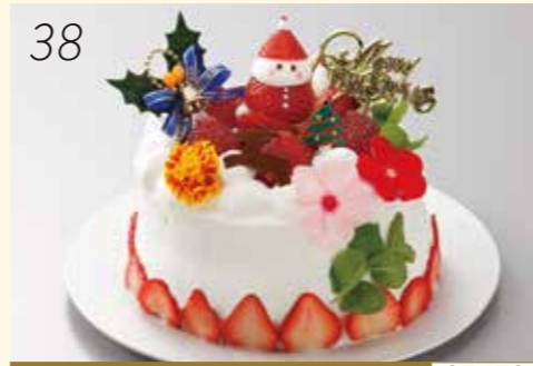
38 お渡し日:12月24日(月・休) 25470 いよてつ 高島屋 限定 サンタ苺とエディブルフラワーが特徴の たっぷり苺をサンドしたふわふわのケーキです。 〈スローエイジングカフェ ユーキチ〉 ふわふわ、丸ごと苺の お花のクリスマスケーキ (直径約15cm) 3,800円 [20個限り]