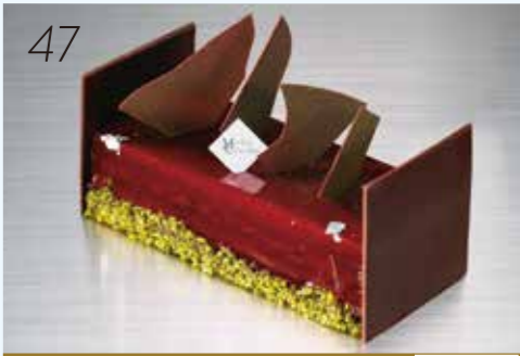
47 お届け日:12月22日(土)→24日(月・祝) 25569 宮崎県産キャンベルのガナッシュとジュレの優しい 甘みがチョコレートのコクを引き立てます。 〈メゾン ショーダン〉 ビュッシュドゥ ノエル ショコラ (約17×7×高さ4.5cm) 5,940円 [3個限り]