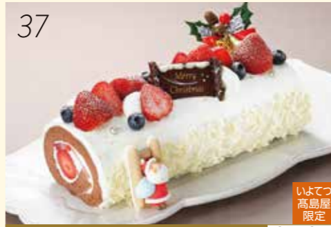
37 お渡し日:12月24日(月・休) 25461 いよてつ 高島屋 限定 たっぷりの苺をふわふわの チョコレート生地で包みました。 〈茶玻璃〉 CHAHARU玻璃ロール ショコラ・フレーズ (約14×23×高さ14cm) 4,320円 [30個限り]