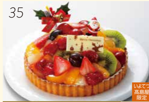
35 お渡し日:12月24日(月・休) 25445 いよてつ 高島屋 限定 アーモンドクリームのタルトに契約農家の 苺などたっぷりのフルーツをのせました。 〈チュチュ〉 クリスマス ジュエリー (直径約18cm) 3,300円 [30個限り]