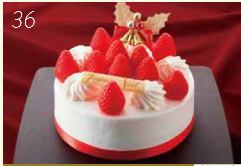
36 お渡し日:12月24日(月・休) 25453 いよてつ 高島屋 限定 コクと深みを追究したホイップ クリームといちごのハーモニー。 〈一六本舗〉 プレミアムいちごショート (直径約15cm) 4,500円 [50個限り]