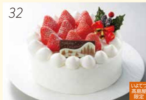
32 お渡し日:12月24日(月・休) 25410 いちごを丸ごと一粒のままで敷き詰めて 贅沢に使ったクリスマスケーキです。 〈ケーキ工房あるもに〉 生クリームスペシャル (直径約15cm) 4,200円 [30個限り]