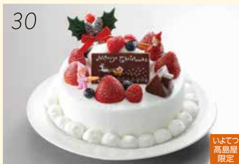
30 お渡し日:12月24日(月・休) 25399 いよてつ 高島屋 限定 莓・ラズベリー・ブルーベリーと、 グラマンニエ風味のクリームを使用。 〈ラ・ブランシュ〉 クリスマス ベリー (直径約15cm) 4,320円 [30個限り]