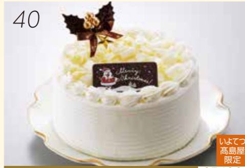
40 お渡し日:12月24日(月・休) 25496 いよてつ 高島屋 限定 自家製カマンベールチーズを使用した こだわりの一品です。 〈ほわいとファーム〉 クリスマスカマンベール シフォン (直径約17cm) 3,500円 [20個限り]