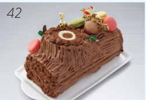
42 お届け日:12月22日(土)→24日(月・祝) 25518 アルデュール人気のマカロントッピング された、切り株型のチョコレートケーキ。 〈アルデュール〉 アルデュールノエル (直径約15cm) 4,104円 [5個限り]