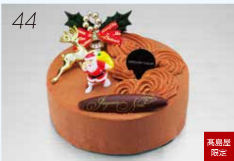
44 お届け日:12月22日(土)→24日(月・祝) 25534 いよてつ 高島屋 限定 クリームプリュレを閉じ込めたチョコレートとキャラメル のケーキをノエル仕立てにしました。 〈パティスリーグレゴリー・コレ〉 ラベユドノエル (直径約12cm) 4,968円 [5個限り]