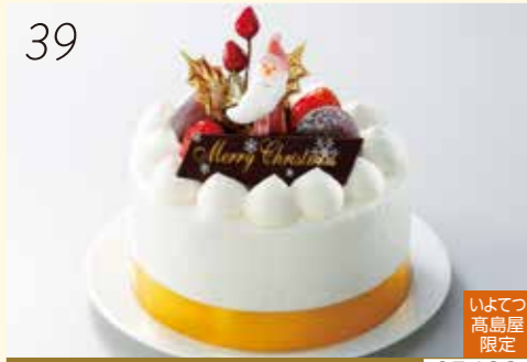
39 お渡し日:12月24日(月・休) 25488 いよてつ 高島屋 限定 こだわりの朱鞠船を使った苺ケーキ は和と洋の絶妙なハーモニー。 〈アン・パティスリー七日〉 あんごと苺の生クリーム スペシャル (直径約12cm) 3,024円 [30個限り]