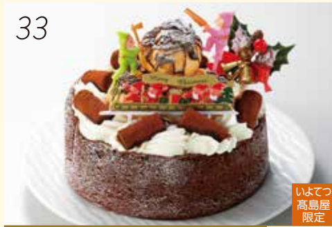
33 お渡し日:12月24日(月・休) 25429 いよてつ 高島屋 限定 しっとり焼き上げたガトーショコラにシュー クリームや新チョコをデコレーション。 〈パティスリーミカンカフェ〉 新チョコクリスマス (直径約15cm) 4,320円 [30個限り]