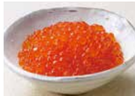
④〈魚伊〉北海道産いくら醤油漬(1パック・120g)…… 1,000円 (50パック限り)