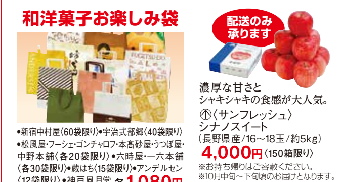
和洋菓子お楽しみ袋 配送のみ承ります 濃厚な甘さとシャキシャキの食感が大人気。 ⑱〈サンフレッシュ〉シナノスイート(長野県産/16~18玉/約5kg) 4,000円 (150箱限り) ※お持ち帰りはご容赦ください。 ※10月中旬~下旬のお届けとなります。 ※配達日指定不可。 ※送料は別途頂戴いたします。