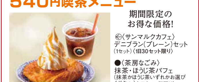
期間限定のお得な価格! ⑮〈サンマルクカフェ〉デニブラン(プレーン)セット(1セット) (1日30セット限り) ●〈茶房なごみ〉抹茶・ほうじ茶パフェ(抹茶かほうじ茶いずれかお選びください) (1日各20個限り)