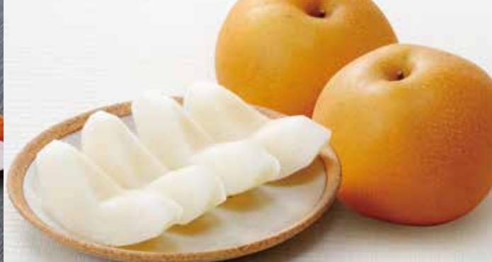
②〈サンフレッシュ〉梨(豊水または秋月/3玉)…… 1,000円 (50セット限り) ※天候により品種が変わる場合がございます。