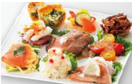
⑲〈RF1〉RF1の30品目サラダセット(1パック)…… 1,404円 (1日10パック限り)