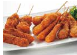
⑤〈富惣〉串揚10本よりどり…… 1,000円 (20セット限り)