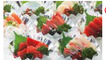
⑨〈魚伊〉お刺身バイキング(1盛) 300円 (300盛限り) ※選りやすい少量盛りになりました。

●〈柿安〉国内産黒毛和牛モモステーキ用(100g当たり)…… 780円 (3kg限り)