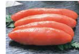
⑦〈マキノ海産〉かねふく辛子明太子(1パック・180g)…… 1,000円