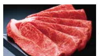
⑩〈柿安〉国内産黒毛和牛肩薄切り焼肉用(100g当たり) 780円 (3kg限り)

●〈篠崎畜産〉国内産黒毛和牛サーロインステーキ用(100g当たり)…… 1,280円 (5kg限り)