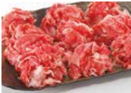
③〈篠崎畜産〉国内産黒毛和牛切り落とし(300g)…… 1,000円 (20パック限り)