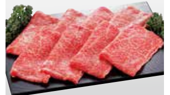
⑧〈篠崎畜産〉愛媛県産黒毛和牛モモ・肩焼肉用(100g当たり) 780円 (3kg限り)

●〈魚伊〉うなぎ蒲焼き(鹿児島産・1尾)…… 2,160円 (50尾限り) ※お一人様2尾まで