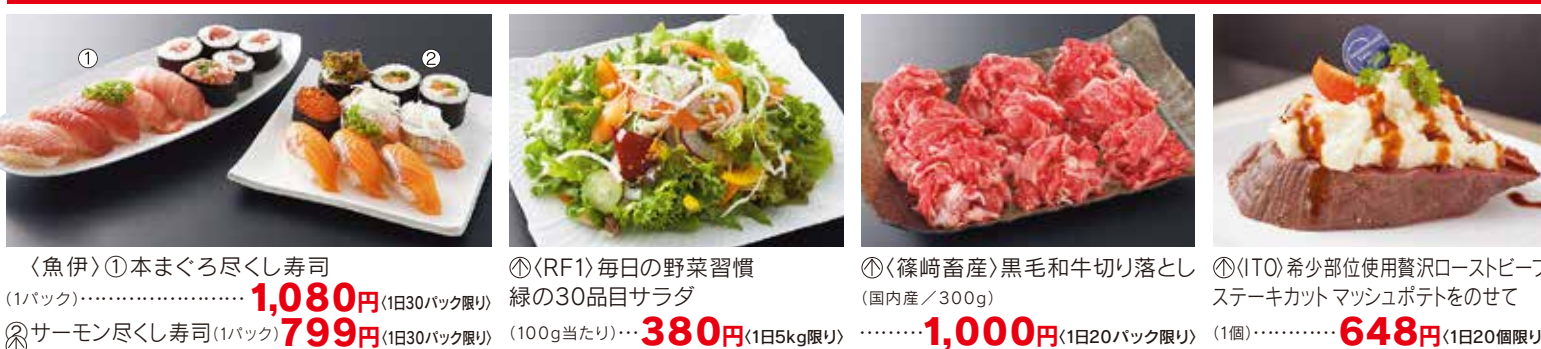
⑳〈魚伊〉①本まぐろ尽くし寿司(1パック)…… 1,080円 (1日30パック限り) ㉑サーモン尽くし寿司(1パック) 799円 (1日30パック限り) ㉒〈RF1〉毎日の野菜習慣 緑の30品目サラダ(100g当たり)…… 380円 (1日5kg限り) ㉓〈篠崎畜産〉黒毛和牛切り落とし(国内産/300g)…… 1,000円 (1日20パック限り) ㉔〈ITO〉希少部位使用贅沢ローストビーフステーキカット マッシュポテトをのせて(1個)…… 648円 (1日20個限り)