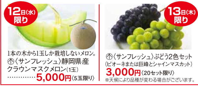
12日(水)限り 1本の木から1玉しか栽培しないメロン。 ⑯〈サンフレッシュ〉静岡県産クラウンマスクメロン(1玉)…… 5,000円 (5玉限り) 13日(木)限り ⑰〈サンフレッシュ〉ぶどう2色セット(ピオーネまたは巨峰とシャインマスカット) 3,000円 (20セット限り) ※天候により品種が変わる場合がございます。