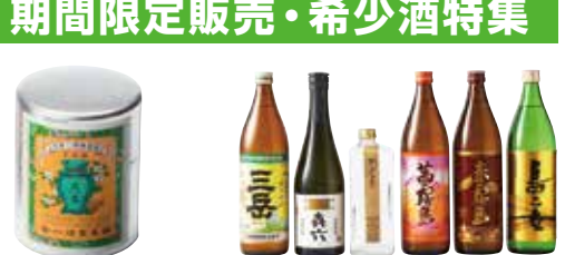
⑪〈一保堂茶舗〉煎茶薫風ミニ缶(30g) 1,080円 (20缶限り) ⑫焼酎6本セット(三岳・茜霧島・赤霧島・島乙女各900ml、岳六720ml、野うぎの走り600ml) 8,706円 (15セット限り) ※お一人様1セット限り ■酒売場