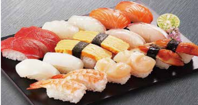
①〈魚伊〉にぎり寿司盛合せ(1パック・18貫入) 1,000円 (60パック限り) ※お一人様2パックまで