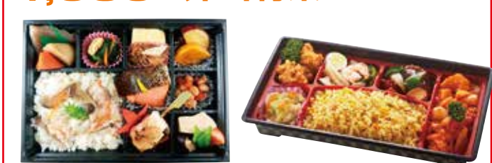
⑬〈まつおか〉秋祭り弁当(1折)…… 1,080円 (1日20折限り) ⑭〈チャイナ・チューボー〉中華弁当(1折)…… 1,080円 (1日5折限り)