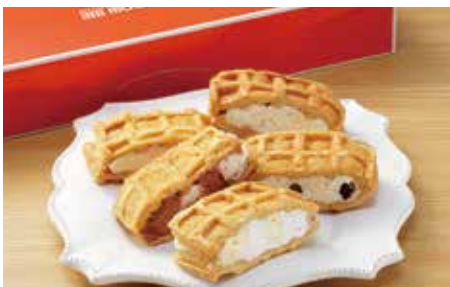
⑳〈ムエル〉ワッフル10個セット(1箱)…… 1,188円 (1日20箱限り)