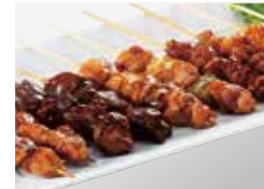
⑥〈焼鳥ピージョイ〉焼鳥10本セット 1,000円 (20パック限り) ※お一人様1パック限り